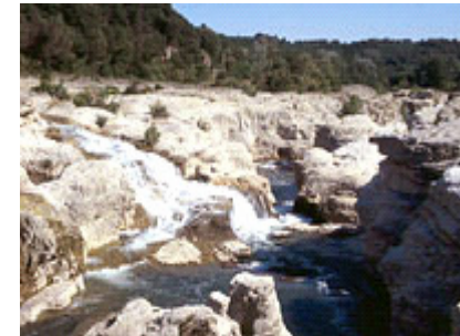
Cascades des Sautadet

wirbelnde Bewegung der Rollen gegraben wurden.