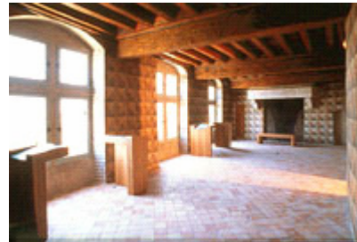
Falzhobelpompsaal von Piolenc - 1450

zum Ende des Mittelalters vergrößert wurde. Gegen 1340 gab der Richter des Königes die Justiz in einem Saal zurück, der in vollkommenem Stand sein kostbar gemaltes Gebälk bewahrt hat. In 1450 ließ Falzhobel von Piolenc zwei übereinanderlegte Pomsäle bauen, deren gemalte Decken uns intakt als der Dekor der Mauern von einem