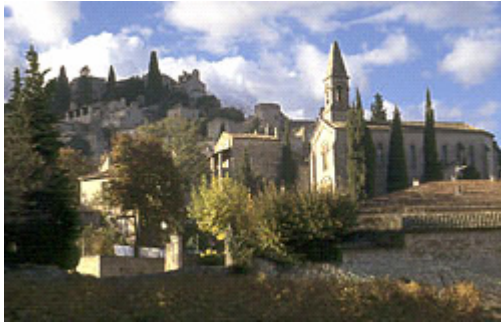
La Roque sur Ceze