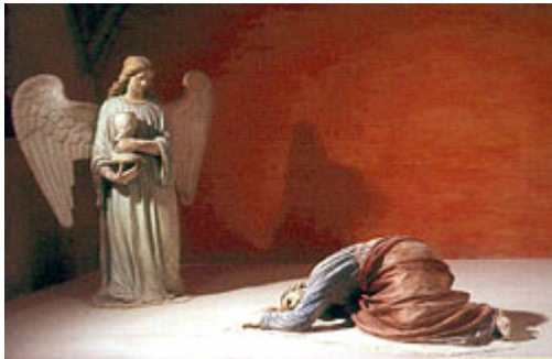
Christus an agnonie

Seit Juli 1995 ist das Haus der Ritter Piolenc, Dynastie von Händlern Getreide des Tales der Rhone, ist offen für die Öffentlichkeit. Sie schützt das gekrönte Kunstmuseum des Gard, das ein kulturelles - und nicht catéchétique Konzept - des religiösen Gefühls des christlichen Okzidents vorschlägt