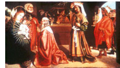
Nicolas Dipre Anbetung von Mages

Öffnungszeiten Alle Tage außer Montag 10 Uhr - 12 Uhr et 14 Uhr - 18 Uhr juillet - aout 10 Uhr - 19 Uhr Möglichkeit geführter Besuche.